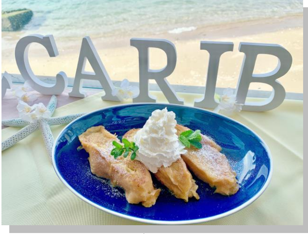
フレンチトースト 680円