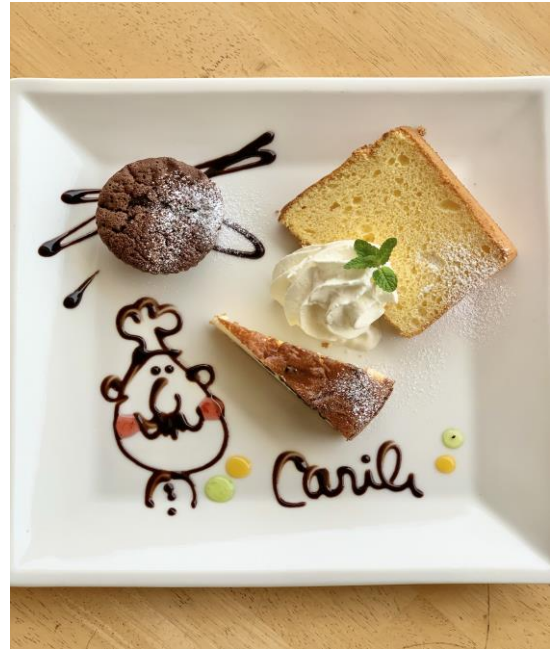
デザート盛り合わせ 750円